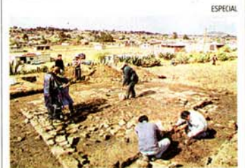
Calixtlahuaca Archaeological Project

El proyecto es financiado por los gobiernos estadounidense y mexicano